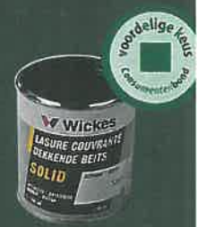
Wickes Dekkende Beits Solid (f15 per bus; f1,53 per m 2 )