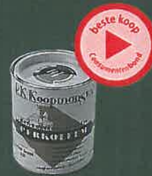
Perkoleum HS Oplosmiddelarm (f25 per bus; f2,58 per m 2 )