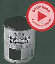
Hema HS Beitsverf art. nr. 81.42.6004 (f20 per bus; f2,44 per m 2 )

Het gebruiksgemak en het gehalte aan organische oplosmiddelen hebben we het zwaarst laten meetellen voor het Testoordeel. Dit kan niet hoger zijn dan het oordeel voor duurzaamheid. Is het oordeel voor oplosmiddelen slecht of matig , dan kan het Testoordeel ook niet hoger uitvallen dan matig/redelijk , respectievelijk redelijk .